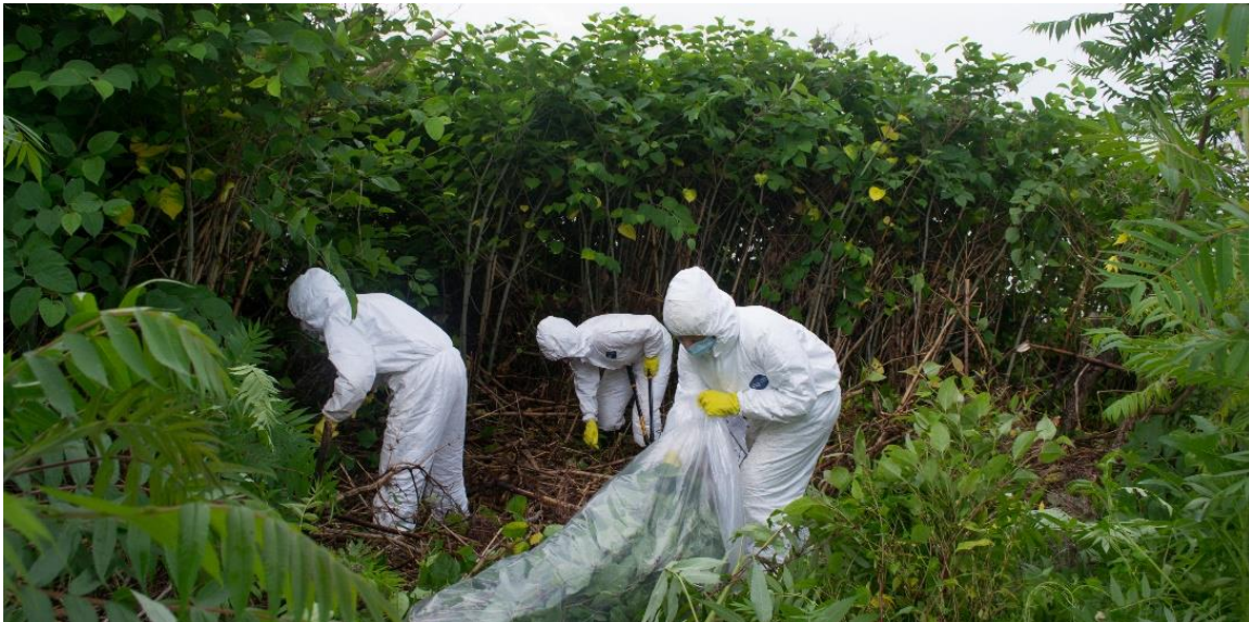
Contrôle de la renouée du Japon à la colonie des grèves de Contrecoeur; Les membres de l'équipe portent un survêtement pour les protéger de l'herbe à puce.

http://zipseigneuries.com/controle_renouee/