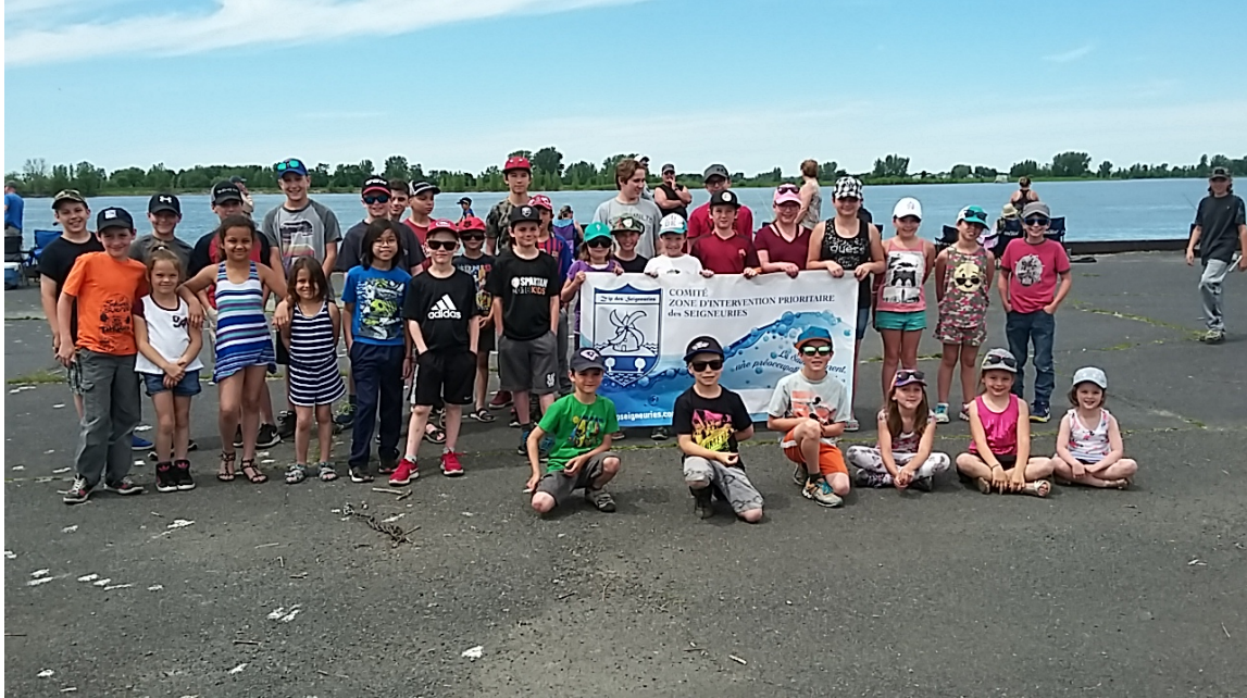
Les jeunes ayant participé à l'initiation en 2018