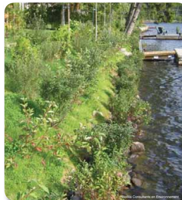
Biofilia Consultants en Environnement