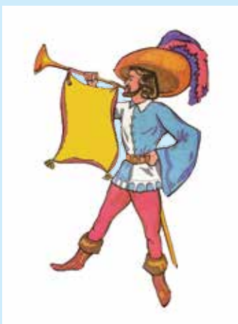
Héraut : officier d'armes chargé de porter des messages importants

Les comités Zone d'Intervention Prioritaire (ZIP) font partie d'un réseau de 13 comités regroupés par Stratégies Saint-Laurent et agissant tout le long du Saint-Laurent, depuis la frontière ontarienne jusqu'au golfe du Saint-Laurent, incluant le Saguenay, la Baie-des-Chaleurs et les Îles-de-la-Madeleine. Le Comité ZIP des Seigneuries est un organisme sans but lucratif dont la mission est de promouvoir et de soutenir, par la concertation régionale, les initiatives environnementales visant l'amélioration de la qualité de vie, l'exploitation responsable des ressources biologiques et l'harmonisation des processus biologique et des activités humaine sur son territoire d'intervention.